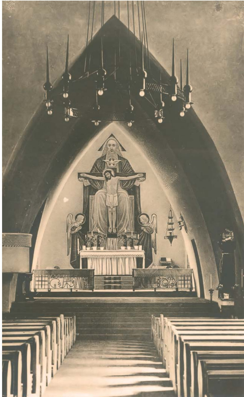
Die 1926/27 nach den Plänen von Dominikus Böhm erbaute Pfarrkirche St. Bonifatius im ursprünglichen Zustand mit dem Hochaltar von Alois Bergmann-Franken