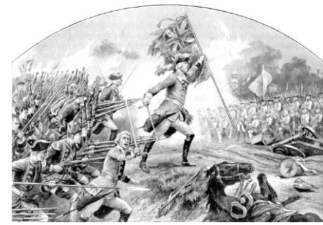
Schlacht bei Dettingen

Die Schlacht bei Dettingen (27. Juni 1743) im Österreichischen Erbfolgekrieg ist das bedeutendste Ereignis in der Dettinger Ortsgeschichte. Ein Diorama , zeitgenössische Ölgemälde und Kupferstiche, Funde vom Schlachtfeld, ein Soldatenzelt mit Ausstattung und Informationstafeln machen mit den Ursachen und Folgen des kriegerischen Geschehens bekannt.